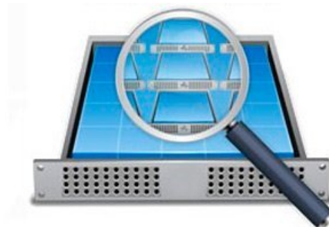
Servidor Privado Virtual